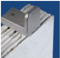
Séparateurs en fibre de verre microporeuse

Seule la batterie Fahrenheit dispose d'un catalyseur de vapeur. Celui-ci retransforme les vapeurs d'acide et réinjecte les gouttelettes dans la batterie ce qui augmente la résistance aux variations extrêmes de température et améliore la durée de vie de chaque cellule.