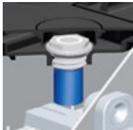
Catalyseur prolongeant la durée de vie