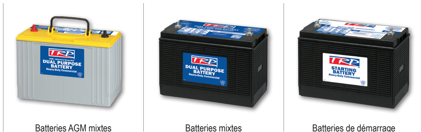
Batteries AGM mixtes